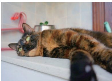
▲不要理我,本喵正在思考喵生