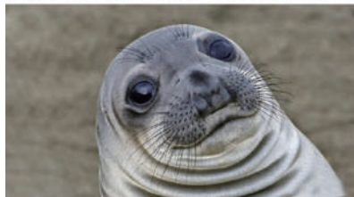
▲哈哈哈哈哈,长得一样一样的