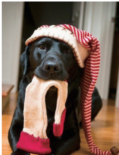
▲零食只是暧昧,袜子才是真爱