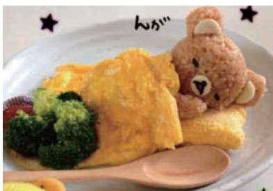
▲看到这么卖萌的食物,还忍得住吗