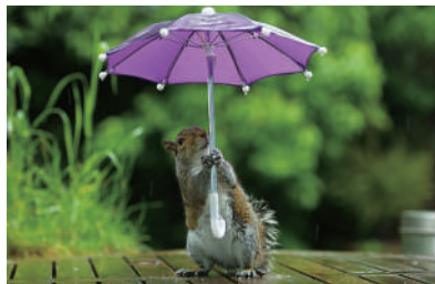
▲下雨了,一起回家吧