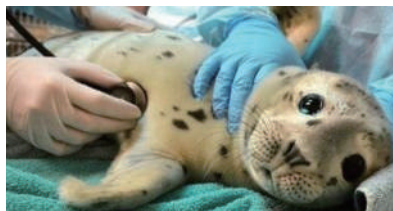
▲小海豹在做体检,看起来萌萌哒