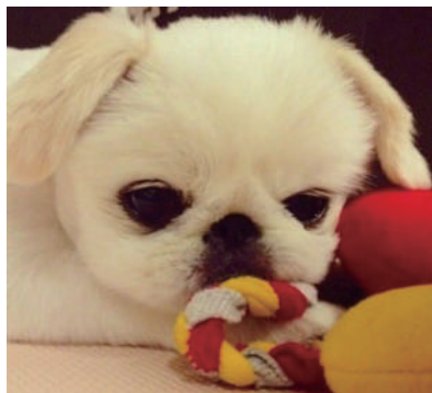
▲一双水汪汪的大眼睛,看起来好无辜