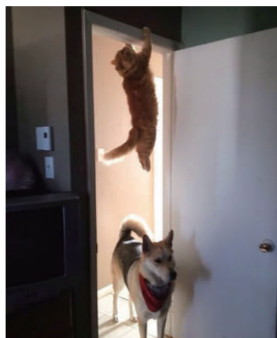
▲那只狗来找我我就说我不在