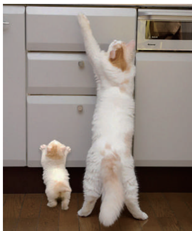
▲传说中的喵星人 plus和喵星人 mini