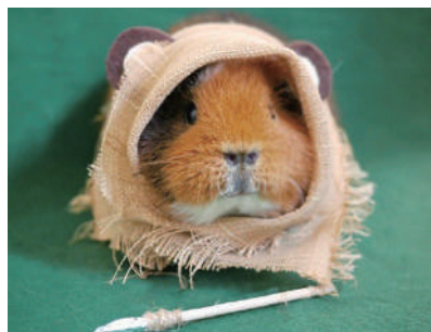
▲来自丐帮的小豚鼠