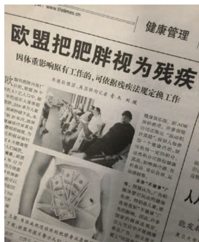
▲突然感受到这个世界对胖子深深的恶意