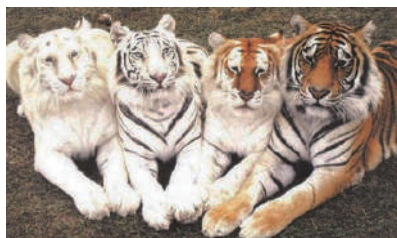
▲下次生之前要记得多喝点墨水