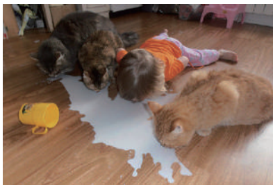
▲和喵星人同玩同食的熊孩子