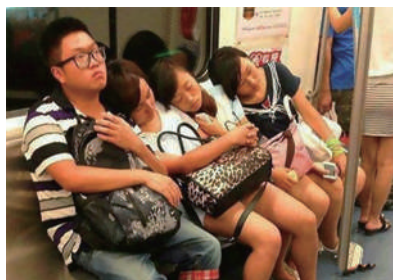
▲大哥,为何还是如此烦恼呢?