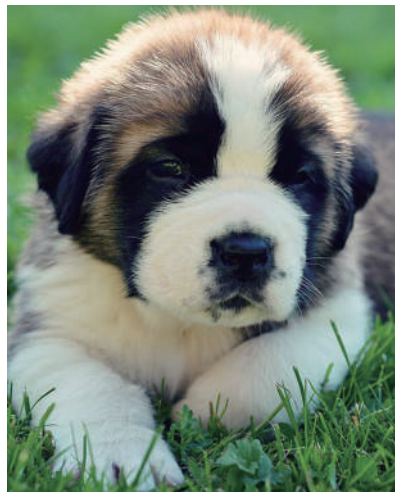
▲我只想做个安静的美男子