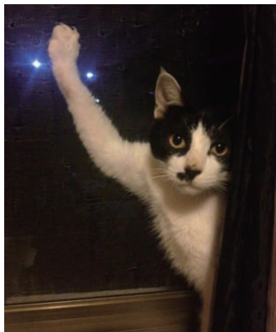
▲黑猫警长在此,老鼠你休要嚣张