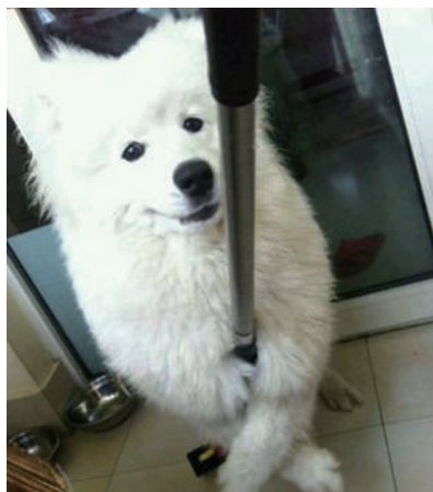
▲妈妈,今天让我来帮你做卫生吧