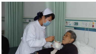
护士协助病人进食