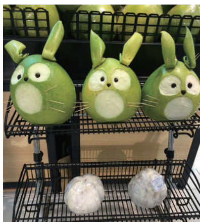
▲创意柚子展·高手在民间