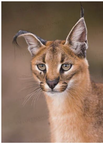
▲从表情一看就知道猫咪是霸道总裁,可是这两撮毛……画风变得也太快了吧,哈哈