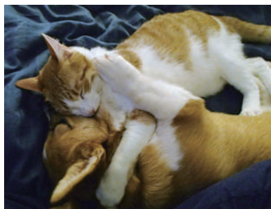
▲柯基犬和喵星人的幸福生活