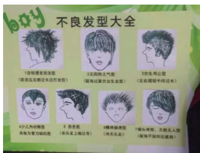
▲男生不良发型大全