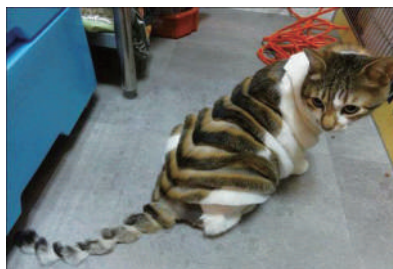
▲不要把我当成切片面包