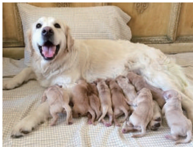
▲好一个温馨的大家庭啊