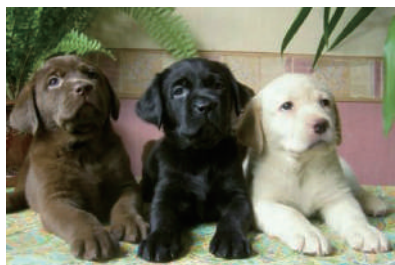
▲来自汪星的暖男·拉布拉多