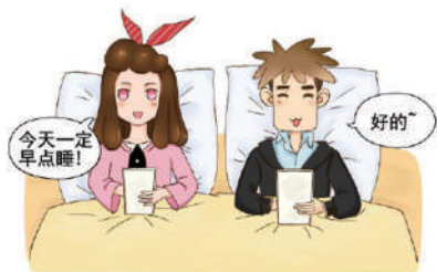
▲人类史上撒过最大的谎言