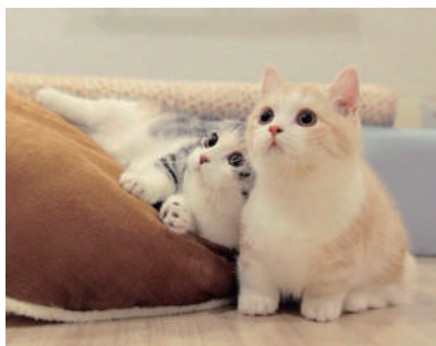
▲可爱小奶猫,萌你没商量