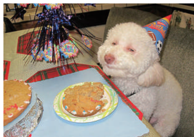
▲豪华生日宴,好开心!