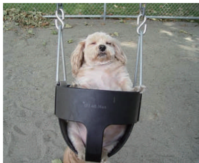
▲可以放我下去了吗?我头好晕