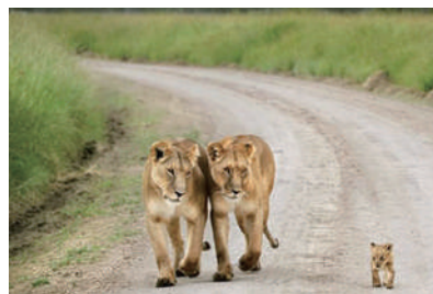
▲“这小崽子长得像你。” “要是像你就悲剧了……”