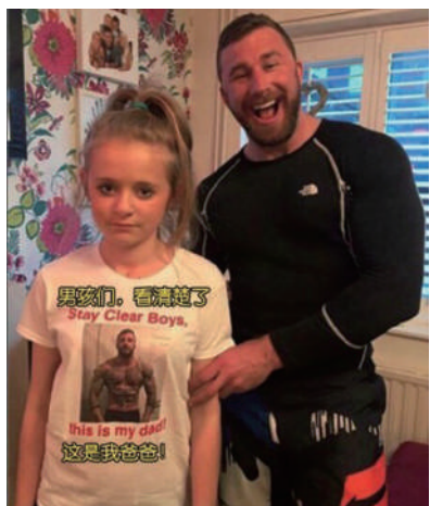
▲爸爸很开心地给女儿做了一件约会必备T恤,但女孩并不是很开心