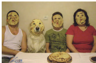
▲真是有其狗必有其主啊