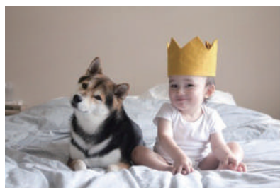
▲ 我能想到最浪漫的事,就是和你一起卖萌