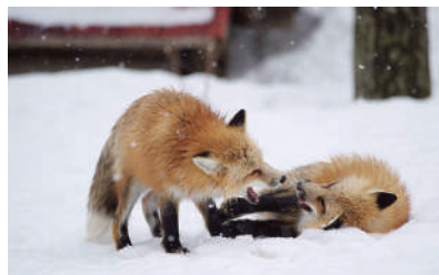
▲ 哈哈哈哈哈,好好笑