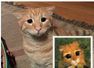
▲ 一张图告诉你女生自拍照与现实的差距