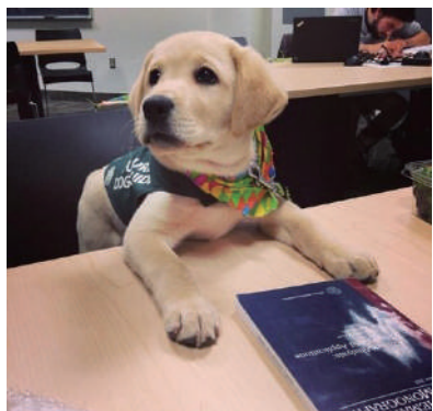
▲ 这本已看完,再来一本