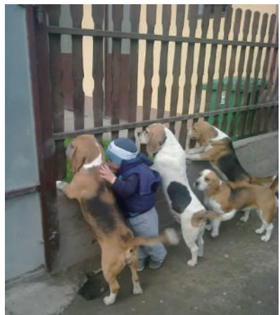
▲真的很好奇对面到底有什么