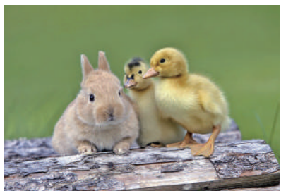
▲好朋友,一辈子,嘎嘎嘎……