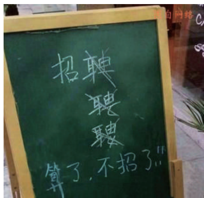
▲是个有血性的汉子