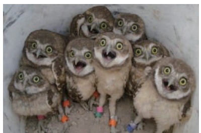
▲可不可以不要欺负我们