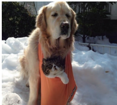
▲汪哥哥,我可不可以先下来玩会儿雪再跟你走?