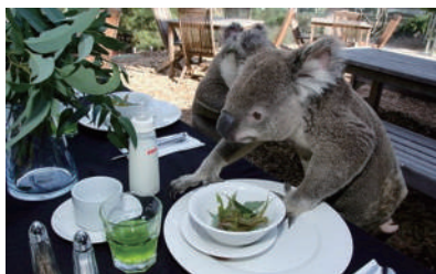
▲早餐不吃好,哪有力气卖萌——美好的一天,从美味早餐开始