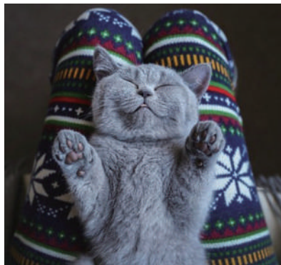
▲有什么会比在主人腿上伸懒腰更舒服的呢