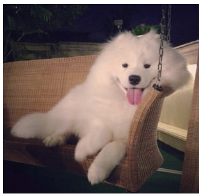
▲小萨,你长得萌还刻意卖萌,这样真的合适吗?