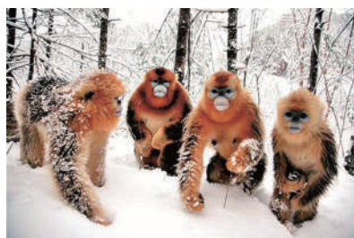
▲我们要去打雪仗了,你要一起吗