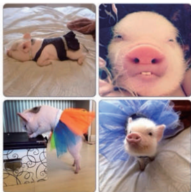
▲二师兄这是要进军演艺圈的节奏吗