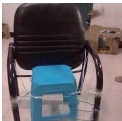
▲这么节约的公司,你根本伤不起啊