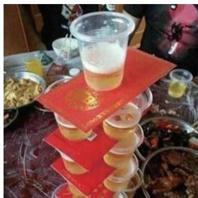
▲这年头,想收个礼金不容易啊