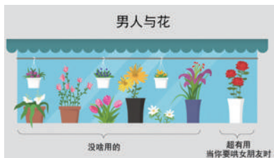
▲如图:你被真相了吗