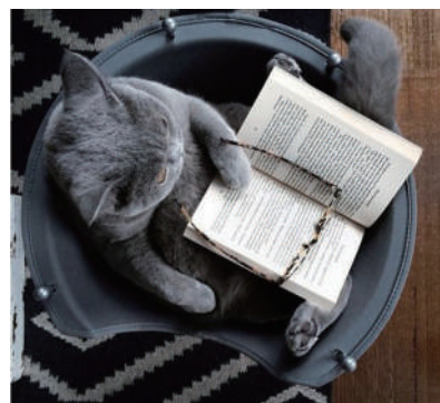
▲一只走文艺路线的喵星人