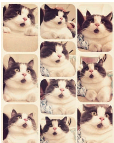
▲我真的没有刻意表达惊讶的意思好吗