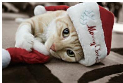
▲这是我的圣诞节装扮,喜欢吗