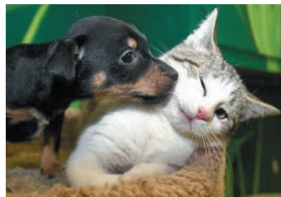
▲别费工夫,我是不会跟你好的