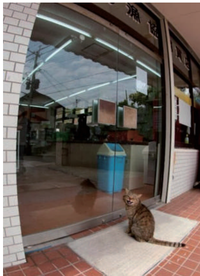
▲等这门一打开,我冲进去叼了小鱼就跑,想想就很开心呢