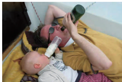
▲千万别让爸爸单独带孩子