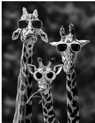
▲长颈鹿先生,你们这样集体耍酷真的好吗