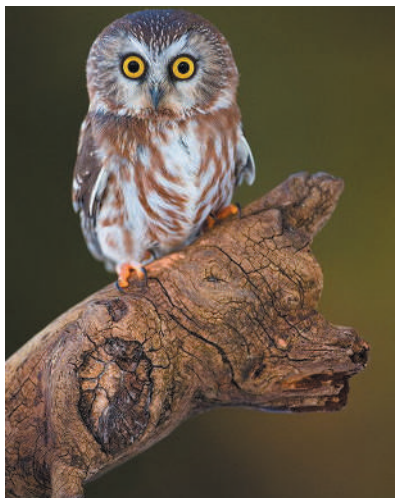
▲是的,你没看错,我打败了这只狼