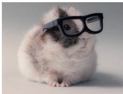
▲戴上眼镜,感觉自己萌萌哒