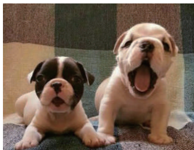
▲英国斗牛犬,想养一只吗