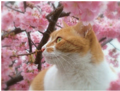
▲时间过得好快呢,转眼又到樱花盛开的时节