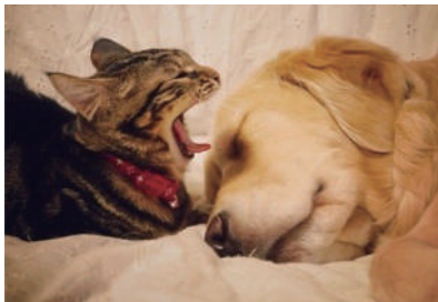
▲春天用来睡觉什么的最舒服了