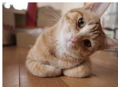
▲对面的,你是在拍我吗