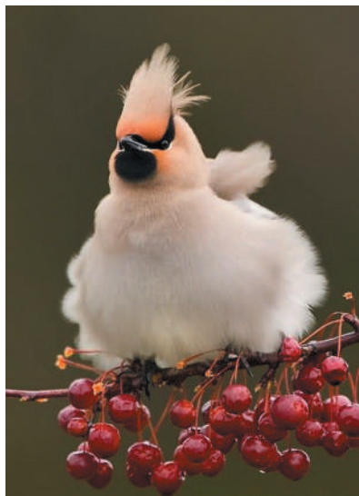
▲这是传说中的怒发冲冠吗