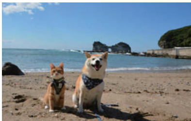
▲我们终于到海边啦