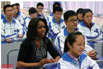
(3月25日,美国第一夫人米歇尔·奥巴马在访问成都第七中学时与当地学生一起上课。)