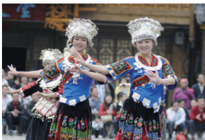
能歌善舞的苗家女