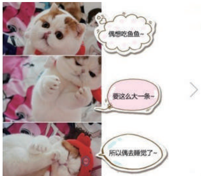
▲ “我想吃鱼……要这么大一一条……算了,我还是去睡觉吧”