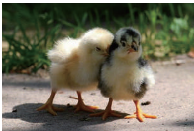
▲ 别生我的气了,好不好嘛