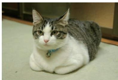
▲ 天冷怎么办? 揣手!