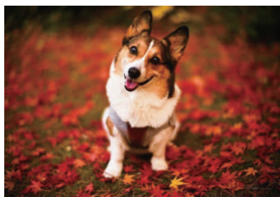
▲ 我最喜欢秋天,你们呢?