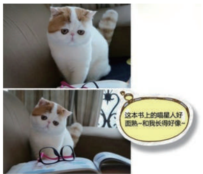
▲这本书上的喵星人好面熟