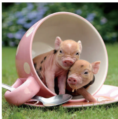
▲今天咖啡味道不错