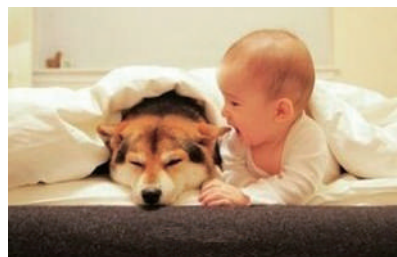
▲麻麻上班去了,别怕,有我保护你