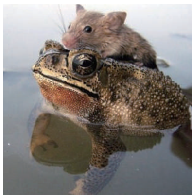
▲兄弟,我要搭个便车