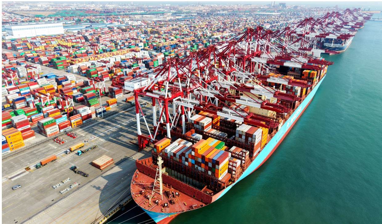
2026年3月10日,在山东港口青岛港,外贸集装箱码头作业一派繁忙(无人机照片)。

增速预期,认为中东局势不确定性对全球经济韧性造成考验。在此背景下中国经济表现稳健,为全球稳定发展注入宝贵的确定性。