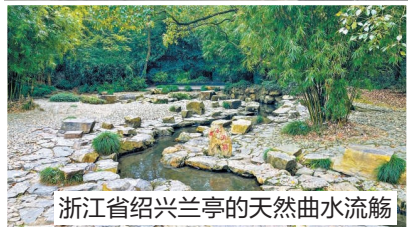
浙江省绍兴兰亭的天然曲水流觞