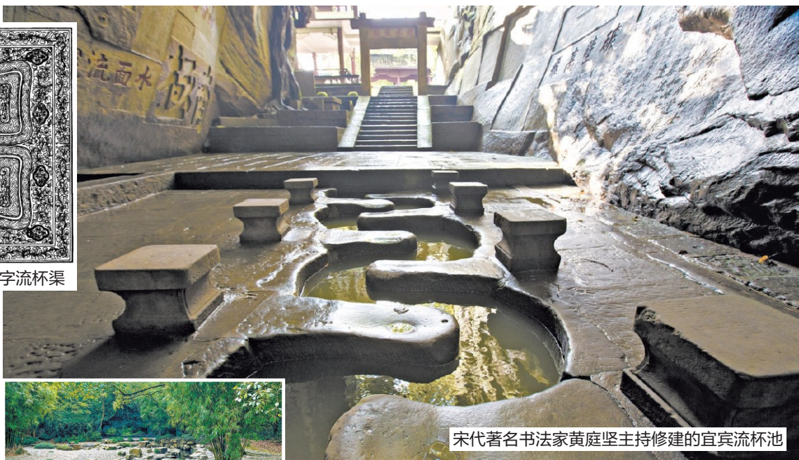
宋代著名书法家黄庭坚主持修建的宜宾流杯池

苏轼的友人、著名书法家黄庭坚也有“流杯之好”。元符元年(公元1098年),黄庭坚谪居戎州(今四川宜宾市),主持修建了凿于天然峡谷之中流杯池。据《嘉庆宜宾县志》等文献记载,“黄庭坚于其中凿(音zhòu,砖石砌筑的井壁)池九曲,为流觞之乐”“黄鲁直凿石为九曲,号流杯池”。意思是流杯池呈九曲形,溪流经过水池后没入石缝,水流九折,水池两边有石凳,可围坐以流杯饮酒。当年黄庭坚常约友人在此流觞饮酒,赋诗酣饮。如今,四川宜宾流杯池公园仍保留着当年九曲石渠的遗迹,池两侧石壁还保留有宋、元、明、清历代名人的诗词和书法石刻。