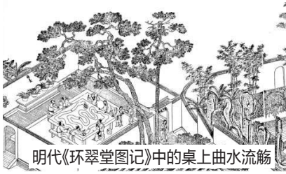
明代《环翠堂图记》中的桌上曲水流觞