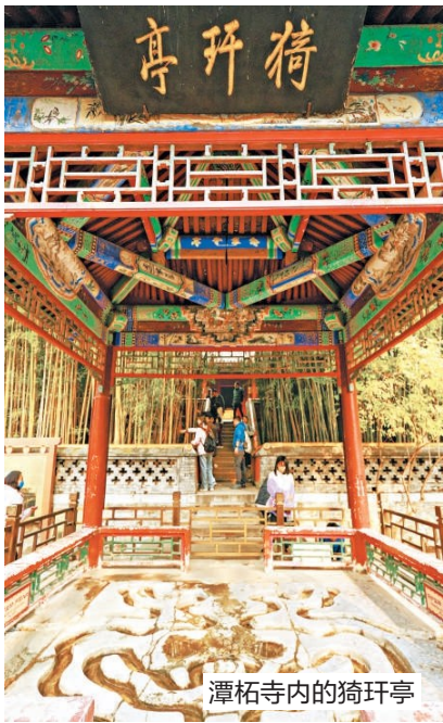
潭柘寺内的猗猗亭