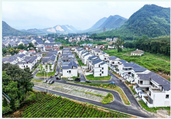
赵李桥镇“爱上你的小屋”