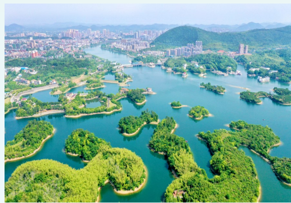
陆水湖风景区自然岛屿