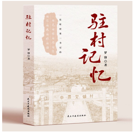
《驻村记忆》 作者:罗锋 出版社:民主与建设出版社

我曾经参加过支教工作,支教和驻村有些共通之处,因此对《驻村记忆》一书产生了浓厚的兴趣。作者以驻村第一书记的视角,通过一个个真实的事例、感人的故事、随笔和感悟,真实记录在河北丰宁乐国窝铺村脱贫攻坚的峥嵘岁月,字字见初心,篇篇显担当。通过此书,我了解了河北丰宁乐国窝铺村的脱贫历程,了解了一位驻村第一书记在自己履职中那份信念、坚守、担当、责任,看到了一名扶贫干