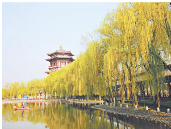
西安大唐芙蓉园周边的柳树与唐风古韵的建筑融合在一起,轻柔醉人。

不仅长安城广种柳树,柳树还被文成公主带到了吐蕃(西藏)。贞观十五年(公元641年),文成公主远嫁吐蕃,嫁妆中就有成捆的杨柳苗。文成公主到达吐蕃后,将长安的杨柳移栽于大昭寺和拉萨街道两旁。高原苦寒,种植不易,公主和随行的园艺工匠费尽心血才将这些柳树种活。这些柳树既增添了当地的绿意与柔美,深扎的根系也守护着河岸。时至今日,在西藏仍有很多柳树荫蔽着当地居民,被人们亲切地称为