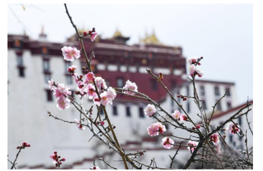
近日,西藏拉萨角禄康公园,桃花竞相绽放。阳春三月,古城拉萨杨柳发芽、桃花初放,春意渐浓。