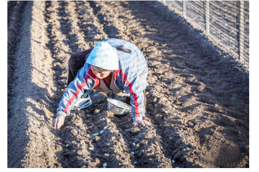
正值春耕,山西柳林穆村镇,蒜农抢抓农时种紫皮蒜,耙地、栽蒜,田间地头一派繁忙。穆村镇紫皮蒜种植历史悠久,已有180多年的传承。