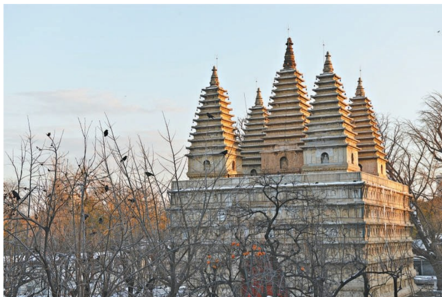
真觉寺金刚宝座塔,建成于明成化九年,雕刻工艺精湛。

神来之笔:鬃毛层叠流畅,肌理分明,周边的卷草纹则暗合明代器物装饰的典雅风尚;马背上的鞍鞯华丽繁复,布满几何纹