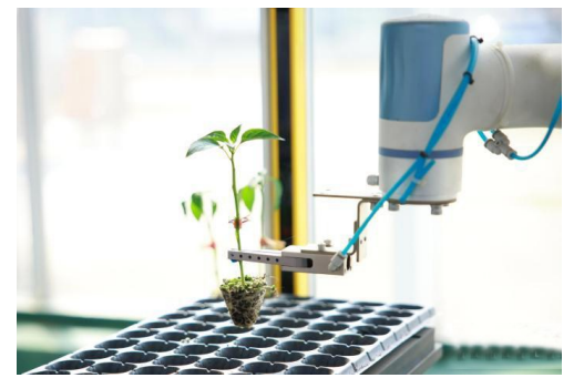
3月11日,机器人在嫁接种苗。眼下正值春耕备耕时节,浙江嘉兴桐乡石门镇数字化种苗工厂抢抓农时,依托先进的智能设备与精细化的管理模式,全力投入农业生产。