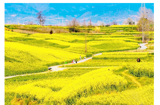
3月11日,陕西省汉中市汉台区皇塘水乡的油莱花盛开,形成连绵金色花海,吸引游客纷至沓来。