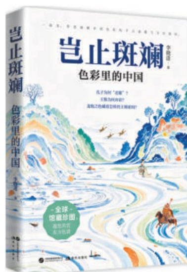
《岂止斑斓:色彩里的中国》 李晓进 著

作者以深厚的学术底蕴和文化史的广阔视野,打破哲学、历史、文学、艺术、考古、民俗等学科界限,让知识自然流淌融合。书中引用的史料精准而独到,从《礼记》《论语》等儒家经典,到《山海经》《博物志》等奇书异志,再到历代《舆服志》、绘画理论、诗词歌赋,信手拈来却恰到好处。严谨的学术支撑确保了内容的深度与可信度,而通俗的表达则让这些养分易于吸收。