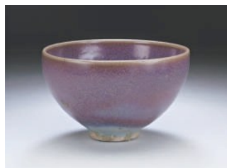
钧瓷玫瑰紫釉碗 ▼北宋末或金初