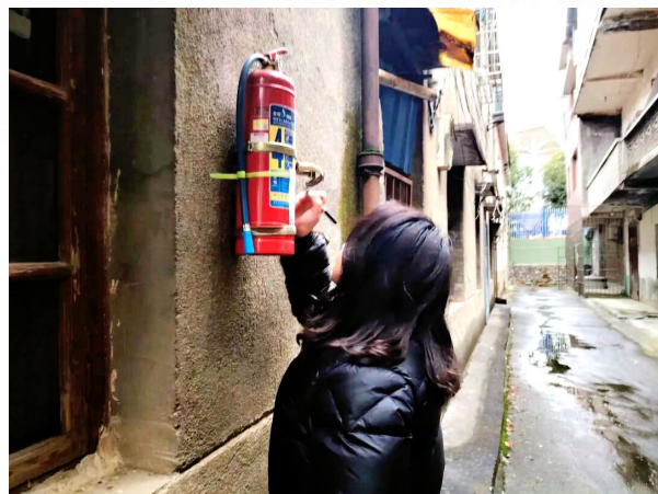
社区网格员检查小区消防设施