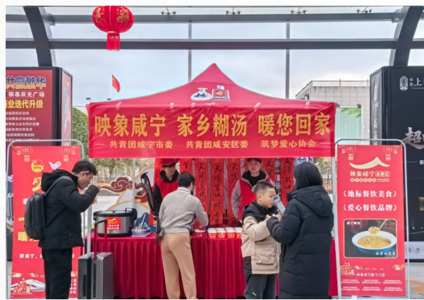
咸宁北站出站口,志愿者为归乡人递上咸宁糊汤