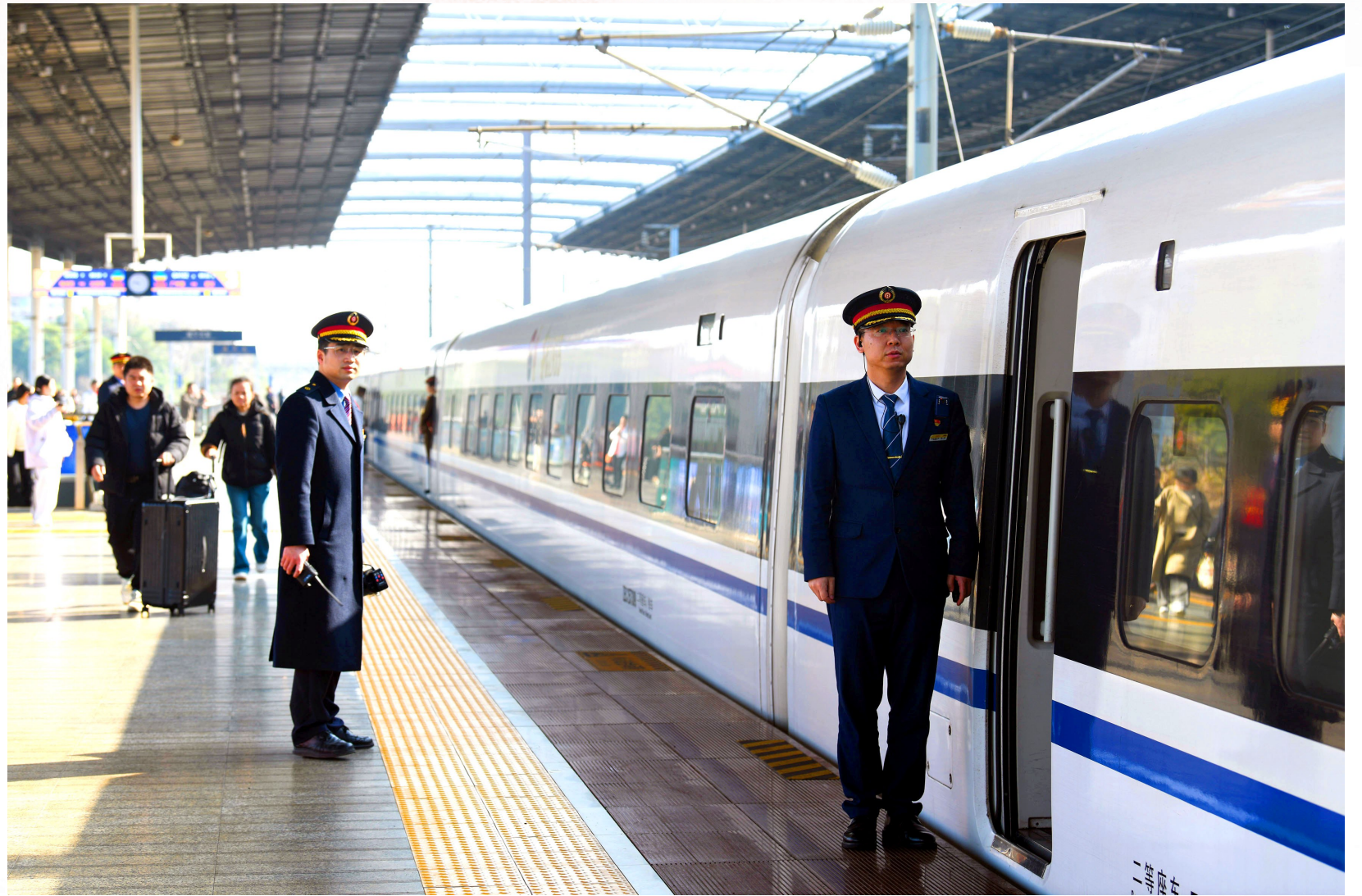
2月22日,咸宁北站迎来节后出行高峰。咸宁北站工作人员加强重点区域值守,优化乘车指引流程,维护站内秩序。记者 陈红菊 通讯员 李言 摄

有一种年味叫团圆,有一种担当叫坚守。春节假期,当千家万户沉浸在欢聚时光中时,许多人舍小家、为大家,坚守在各自的岗位上。他们全力以赴,守护平安;他们贴心服务,排忧解难;他们日夜奔波,保障民生……点点微光,汇成星河。他们用默默付出,守护着万家灯火的祥和安宁。今起,本报推出“假期我在岗”特别报道,定格这些最美的坚守瞬间。