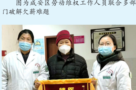
图为患者向咸安区中医院老年科全体医护人员赠锦旗表示感谢