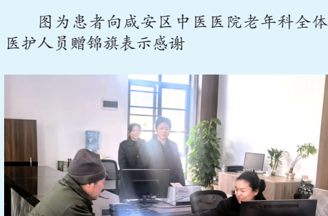
图为逝者家属办理“四免一送”惠民减免