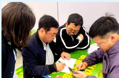
图为咸安区“校园餐”询价小组在武商量贩开展询价