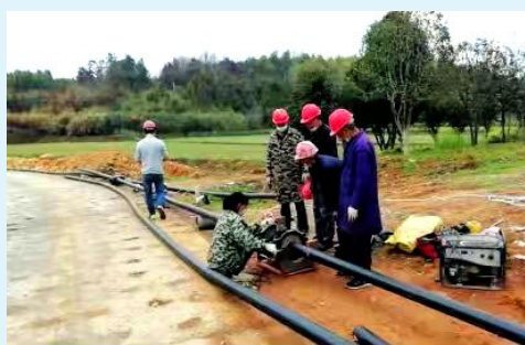
图为星岗线供水管网延伸改造项目施工人员在四门楼村段从事热熔焊接管道施工