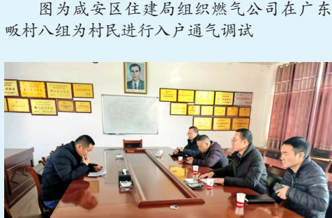
图为咸安区劳动维权工作人员联合多部门破解欠薪难题