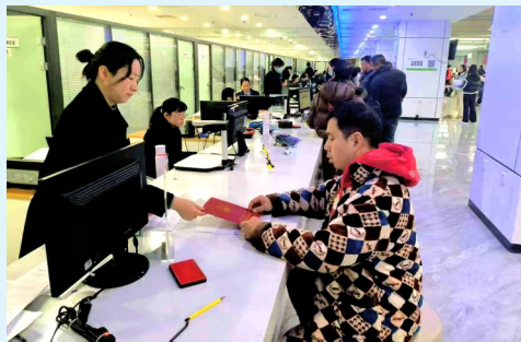
图为居民在咸宁不动产登记窗口办理不动产转移登记

下一步,咸安区将不断完善殡葬公共服务体系,持续优化服务举措,健全长效监管机制,加强殡葬惠民政策和移风易俗宣传,提升群众知晓率,让惠民红利持续释放,切实提升群众的获得感、幸福感和安全感。(晏江涛)