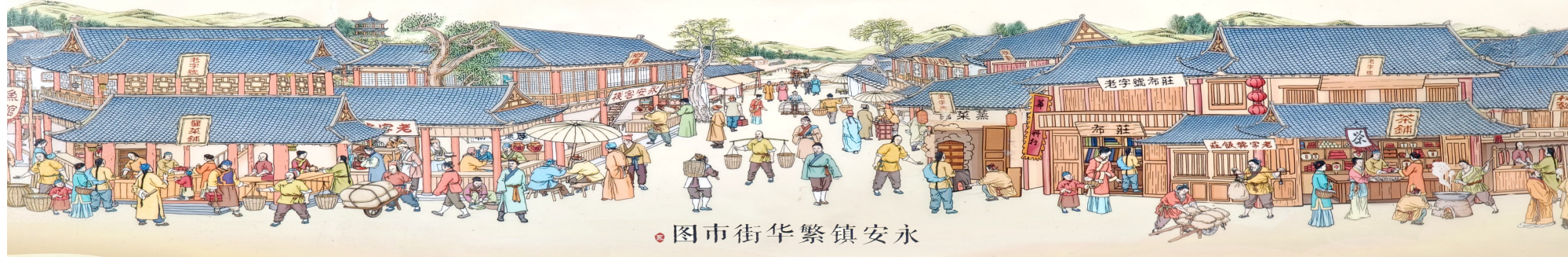
图市街华繁镇安永

这或许就是“以人为尺度”的城市哲学:最好的改造,是让居民在熟悉的家园里,遇见更美好的生活。