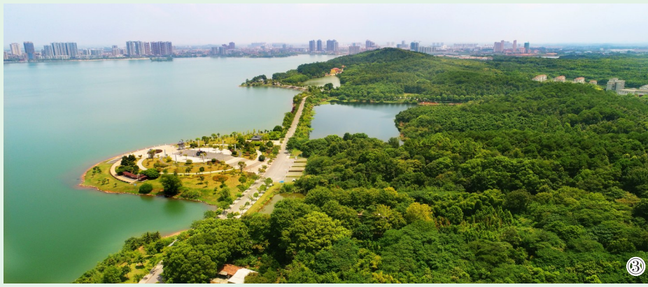
图① 赤壁市黄盖湖湿地，良好的生态每年吸引大批候鸟来越冬。图② 咸宁大洲湖湿地公园，碧绿的湖水与葱郁植被相映成趣。图③ 嘉鱼县三湖连江，碧波绕翠岭，湖光映蓝天，构成了一幅如诗如画的自然画卷。图④ 赤壁市陆水湖国家湿地公园，竹海、湿地、绿水构成了一幅生态画卷。