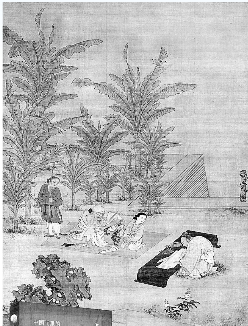
伏生授经图 明 杜璿

1981年，哲学家冯友兰发表了一篇书评《论形象——评〈中国古代著名哲学家肖像〉的插图艺术》。虽然书评主要探讨的是插图艺术，但提出了两个相互关联的问题：这些古代哲学家的画像究竟像不像？像不像的根据和标准又是什么？后者是更深层次的问题。以孔子的画像为例。历史上的孔子，是不是就真是画像中所画的那个样子？如果“像不像”是以历史上的孔子为准，那就很难说了，因为孔子距离我们两千多年，现在不可能有人见过孔子，也不可能有人见过看到过孔子的人。文章提出，画像像不像的根据和标准，“就是这些哲学家们用他们的思想和言论在后人的心中所塑造的形象”。很显然，用今日传播学理论来分析，所谓的客