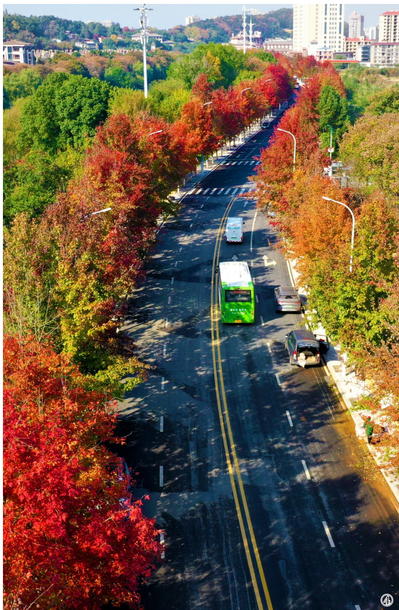
初冬时节,漫步在咸宁的街头巷尾,仿佛踏入了一幅色彩斑斓的画卷。 ① 潜山国家森林公园,或红或黄的树木与常绿植被相互映衬,构成了一幅绝美的山水画卷。 ② 滄河月亮湾段,河两岸的树木换上了斑斓的盛装。 ③ 十六潭公园,游客在湖面悠然泛舟,沉醉在这如诗如画的美景中。 ④ 城区孟养浩东路,两行枫树已悄然染红,宛如两条蜿蜒的红绸带,在阳光下熠熠生辉。