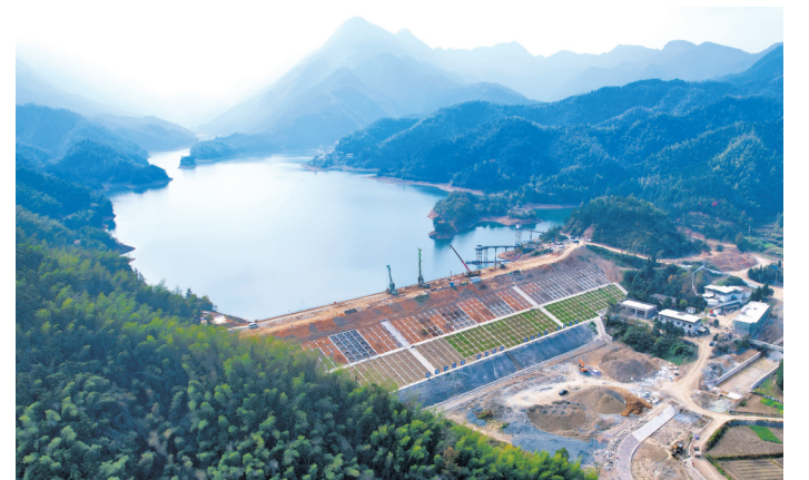
11月4日,通山县南林桥镇雨山村雨水库除险加固工程现场,施工人员正加紧推进大坝坝体新建混凝土防渗墙作业。该工程于今年2月28日正式开工,建设内容包括大坝加固、溢洪道改建、环境保护、水土保持及信息化系统建设等,计划于明年汛前完成全部土建主体工程,全力筑牢防汛安全屏障。

市自然资源和城乡建设局相关负责人表示,我市将以大坪乡项目为样板,进一步深化全域国土综合整治工作,推动更多地区实现耕地保护、生态改善、产业发展和乡村振兴的协同共进。