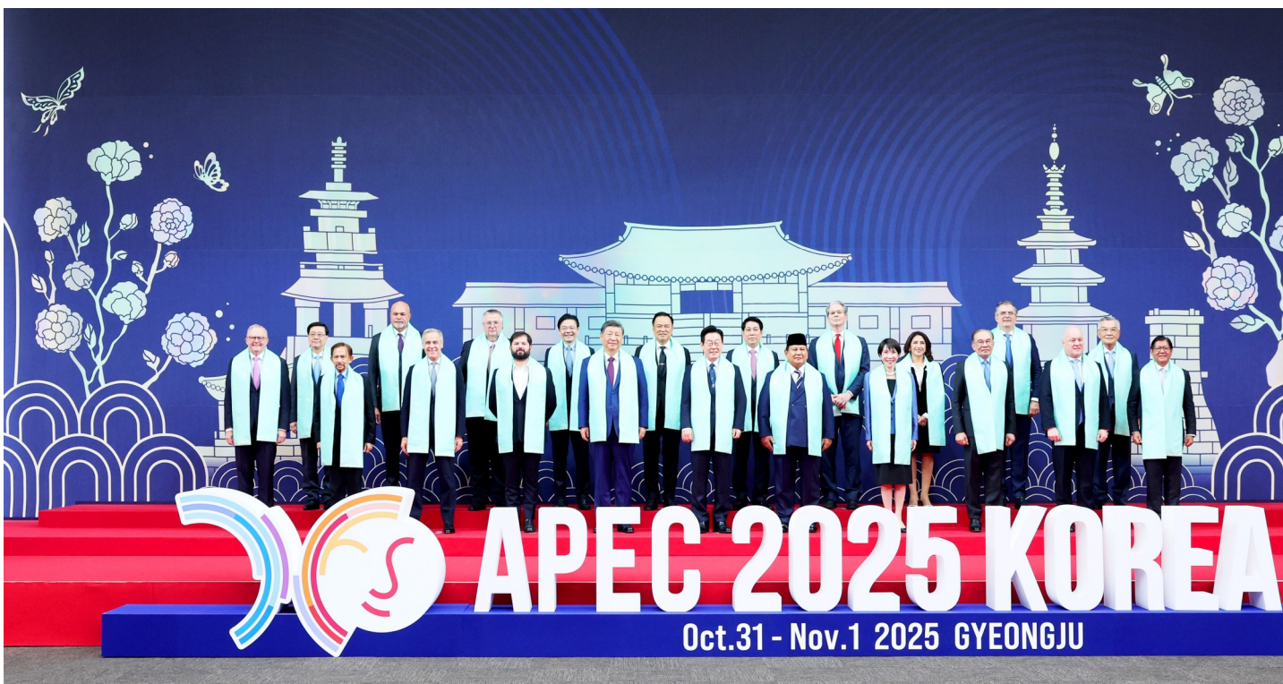
当地时间11月1日上午,国家主席习近平在韩国庆州出席亚太经合组织第三十二次领导人非正式会议第二阶段会议,并发表题为《共同开创可持续的美好明天》的重要讲话。这是会后,与会经济体领导人、代表集体合影。

新华社韩国庆州11月1日电 当地时间11月1日上午,国家主席习近平在韩国庆州出席亚太经合组织第三十二次领导人非正式会议第二阶段会议,并发表题为《共同开创可持续的美好明天》的重要讲话。 习近平指出,当前,新一轮科技革命和产