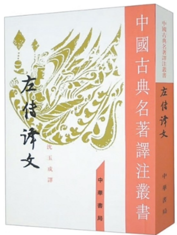
《左传译文》:沈玉成译;中华书局出版。

内容简介:丛书带小读者观察和记录根茎花叶果等细节特征,探索植物生长的秘密。(本报综合)