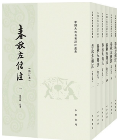
出版。《春秋左传注》:杨伯峻编著;中华书局出版。

《左传》与《春秋》相互辉映,求索和回答那个对个人、对共同体都至关重要的问题:何为正当,何为正义?这就是《春秋》大义:我们拒绝成为一个弱肉强食、唯利是图的自然社会,我们坚信,人与社会都有更高、更值得追求、值得抛头颅洒热血的根本价值。晋武帝司马炎问杜预:你这个人嘴不饶人啊,王济爱马,你说他有“马癖”,和峤贪财,你骂他有“钱癖”,请问卿有何癖?杜预答道:我有“左传癖”。