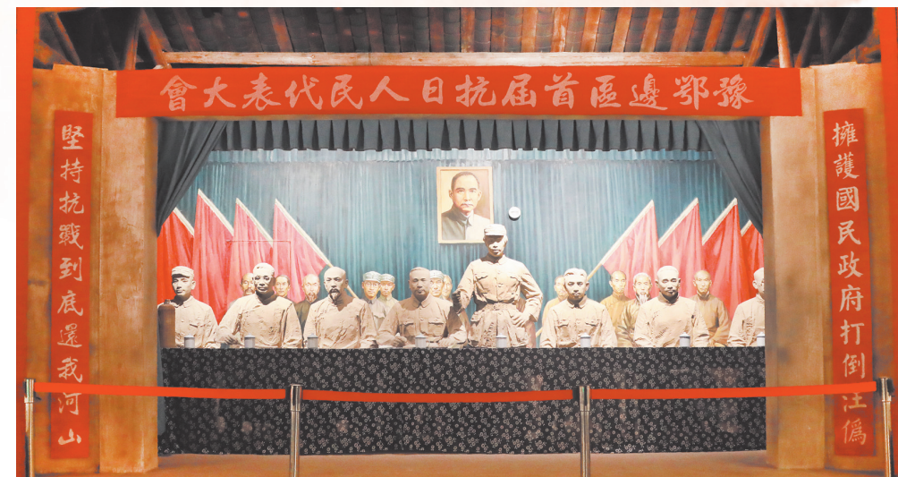
1942年3月,鄂豫边区在向家冲罗家祠堂召开第一届抗日人民代表会,颁布了《鄂豫边区施政纲领》。