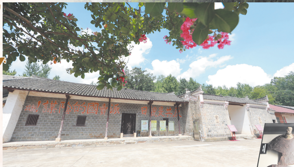
中共豫鄂边区委员会旧址。

小焕岭,作为中共豫鄂边区委员会驻地、豫鄂边区开辟创立时期的指挥基地,载入了史册。2013年,被国务院公布为第七批全国重点文物保护单位;2021年,被认定为湖北省首批不可移动革命文物。这里,成为红色传统教育的重要阵地。