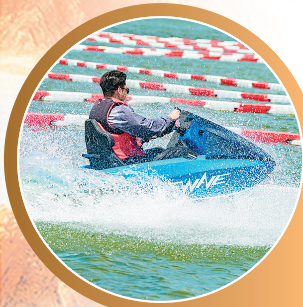
金牛湖景区推出卡丁船项目受游客追捧。