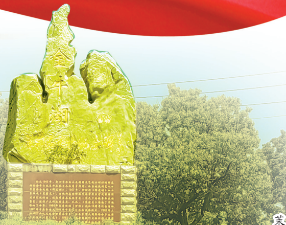
茉莉花采风纪念碑矗立在金牛湖旅游度假区。

从伟大抗战精神中汲取前行力量,在《茉莉花》旋律中氤氲“茉莉芬芳”。金牛湖旅游度假区管理办主要负责人表示,度假区正立足“运动胜地、亲子营地、研学高地、康养福地”定位,以“国家级旅游度假区”和“国家级户外运动目的地”创建为关键抓手,着力丰富文旅产品业态、推动优质项目落地,努力打造成为文旅投资新热土、产业发展新高地。