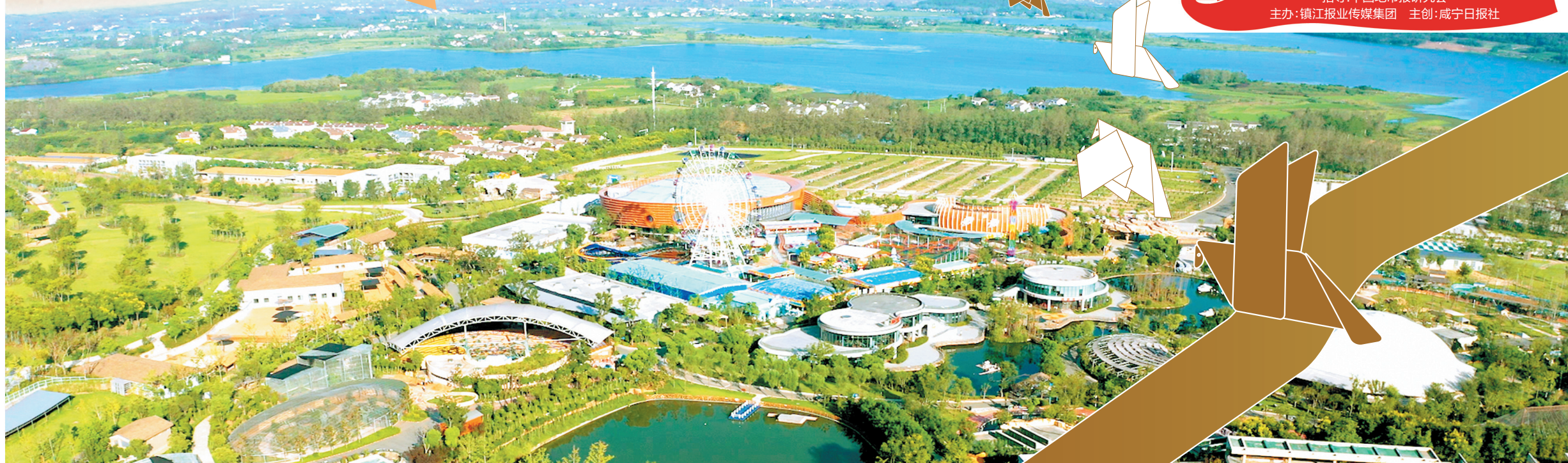
金牛湖旅游度假区业态多元。