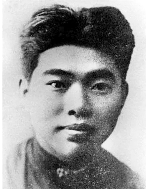
何功伟,又名何明理,化名何彬、何斌。1915年出生于咸安区桂花镇柏墩村,1941年牺牲于恩施。

内容简介:本书探讨了中国执笔法的演变,为书画教育中执笔法的教学提供学理基础,以图像实证活化传承中华文脉,实现传统执笔法与当代学术的跨时空对话。(本报综合)