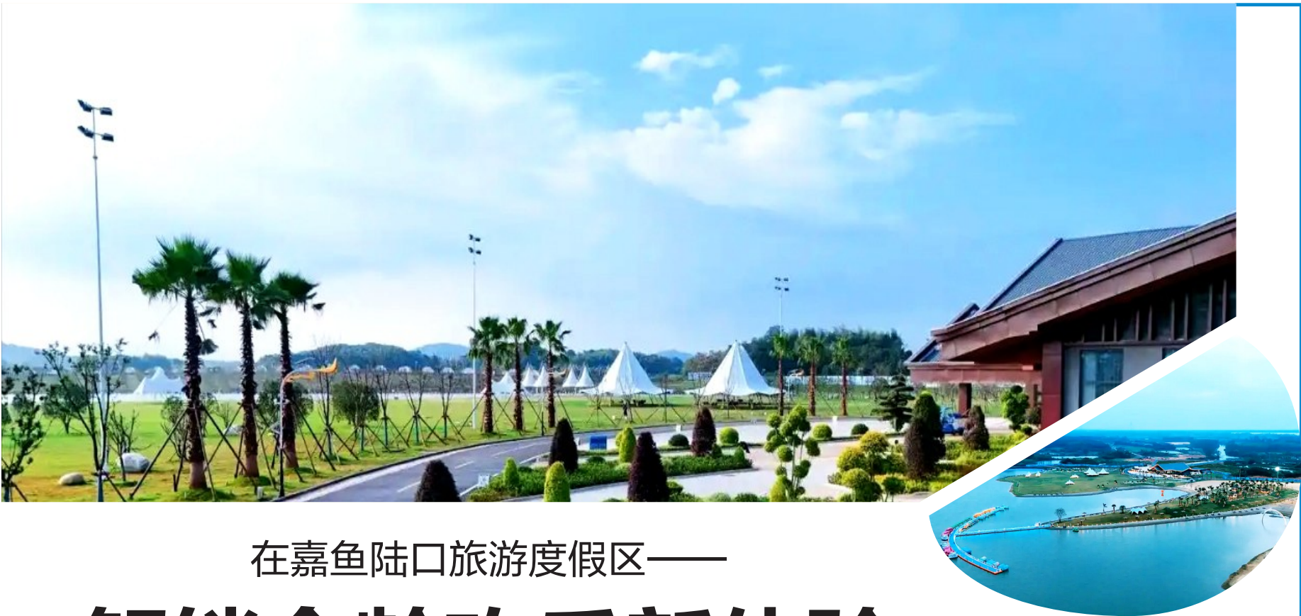
在嘉鱼陆口旅游度假区——