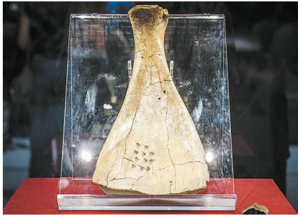
甲骨文解锁神秘王朝

在“看·见殷商”展上,展出了一块由碎甲片缀合而成的完整乌龟腹甲和一块牛肩胛骨。两块甲上依稀可见灼烧后的洞孔、裂纹和刀刻的文字,这是殷商时期典型的卜甲和卜骨,上面所刻文字就是甲骨文。殷商时期的甲骨文大部分都是刻在这种平整、坚硬的龟甲和牛骨上的。当然,也有刻在其他动物骨头上的,比如鹿骨、象骨等。