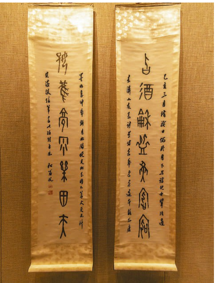
甲骨文存活至今的密码

世界上有四大古文字,古埃及象形文字、巴比伦楔形文字、印第安人玛雅文字都已失传,惟有中国的甲骨文历经3000多年,从金文、小篆、隶书再到楷书,一脉相传地“活”到现在,并演变成今天的汉字。这不得不让人赞叹中国人祖先的智慧与华夏文明的源远流长。