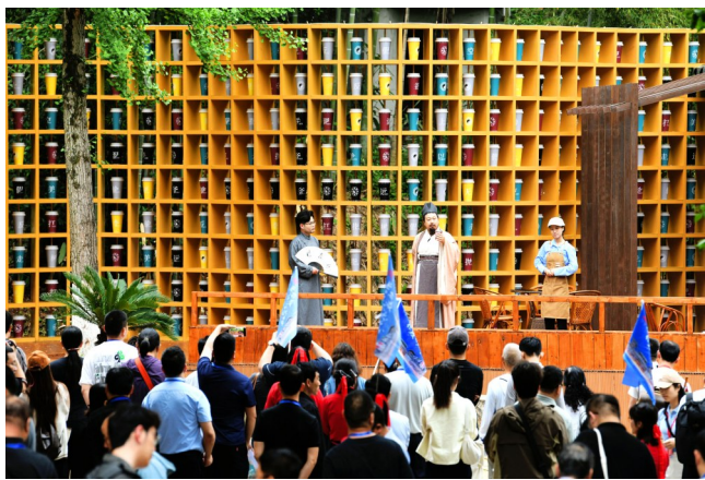
赤壁古战场景区,演员以说书的形式为游客讲述三国、赤壁的精彩故事。