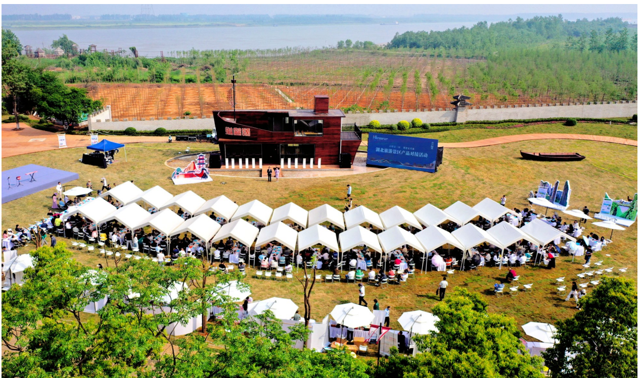
湖北旅游景区产品对接活动在三国赤壁古战场举行，全省旅游景区代表、全国文旅产品采购商及供应商等齐聚一堂，推进景区与市场双向奔赴。