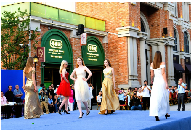
羊楼洞新镇商街,俄罗斯模特表演走秀。