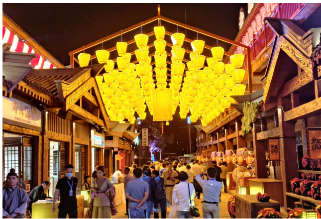
游客夜游三国赤壁古战场“东风街”。