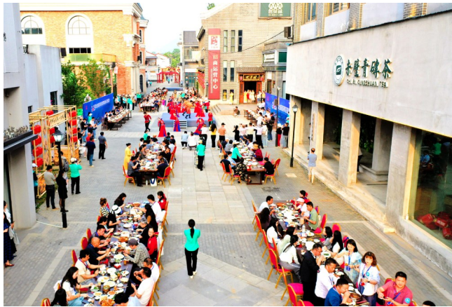
羊楼洞新镇商街举行万里茶道特色文化长桌宴。