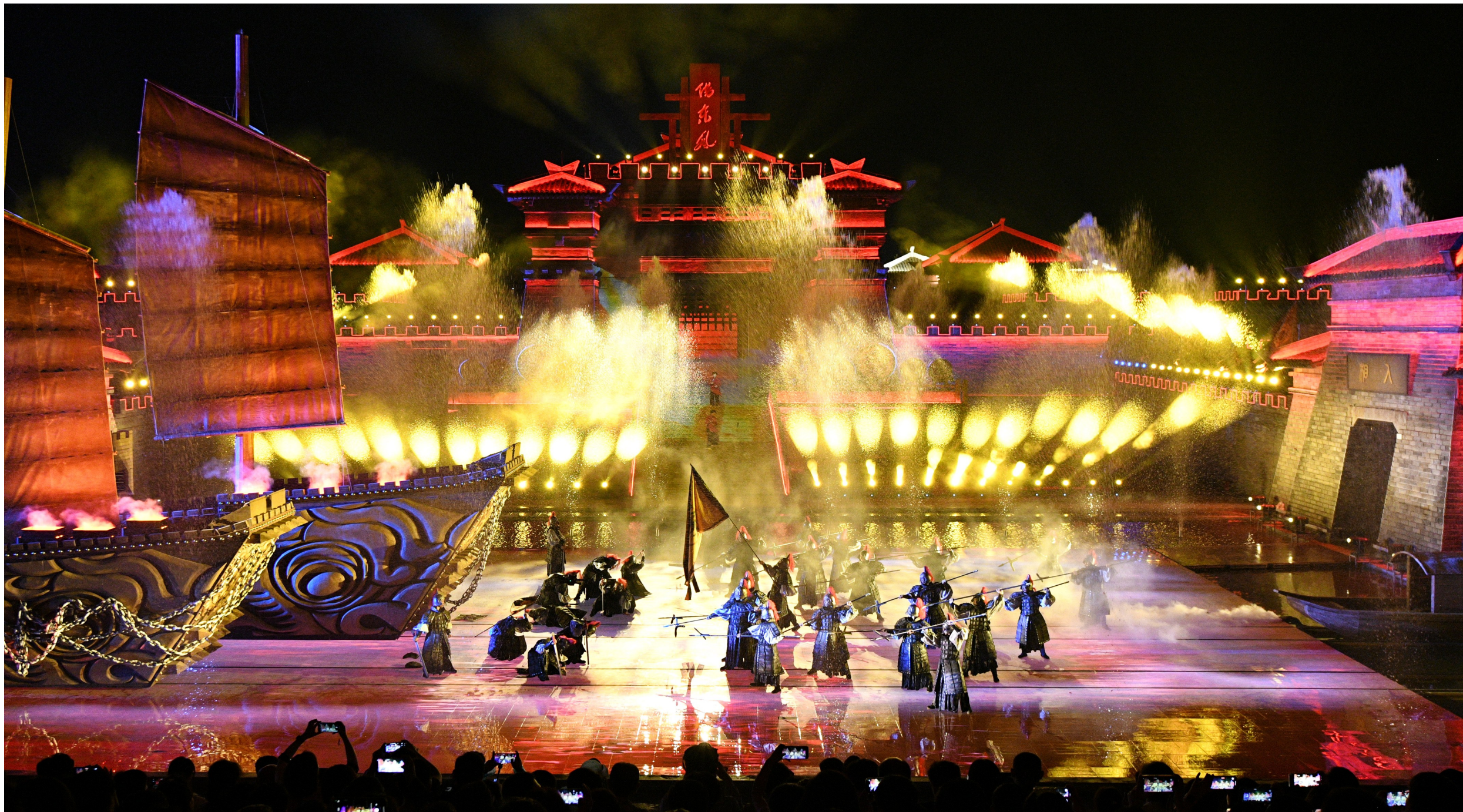
赤壁古战场景区东风街,大型三国文化实景剧目《赤壁·借东风》首演现场。