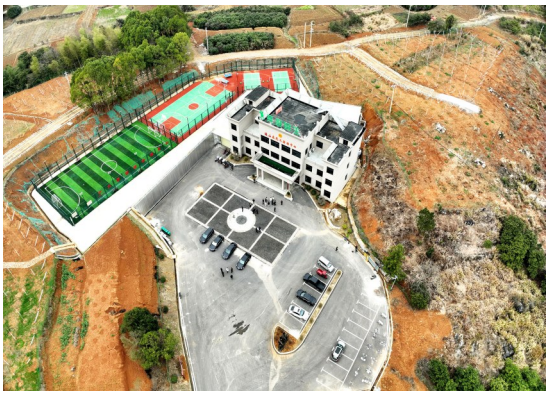
大畈隐水活动中心