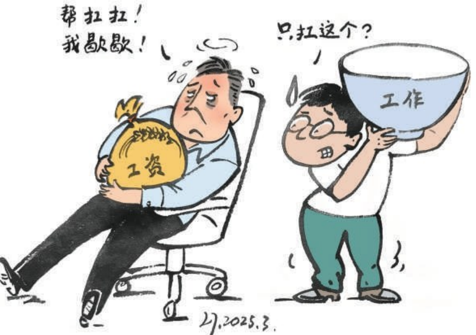
如今,一些职场人士通过将工作“转包”、委托别人完成的方式来减少工作负担,获取更多的自由时间。“转包工作”存在法律风险,承接者的权益也难以保障。员工“转包工作”要慎重,企业也要合理分配任务,别让员工逼成“分包商”。 李嘉/文并图