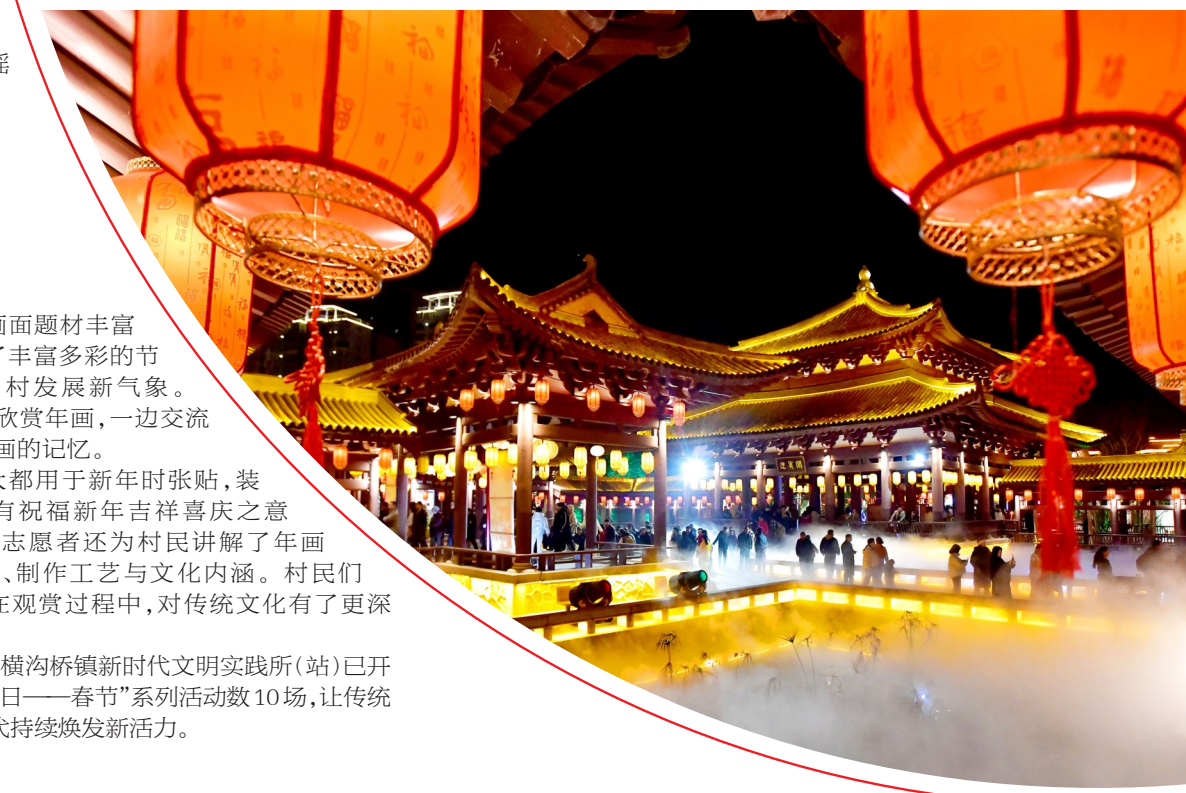
▲1月28日,农历除夕,咸宁龙潭里景区沉浸在浓浓的宋韵风情里,人气火爆。

踏入景区,仿若穿越回大宋盛世。游客们身着宋代服饰,穿梭于古色古香的亭台楼阁间,打卡、赏景、拍照。景区精心编排的宋代民俗表演,吸引了众多游客驻足观看,现场喝彩声不断。在这充满年味的蛇年春节,龙潭里景区以独特的宋韵魅力,成为来咸八方游客们探寻历史、欢度佳节的热门打卡地。