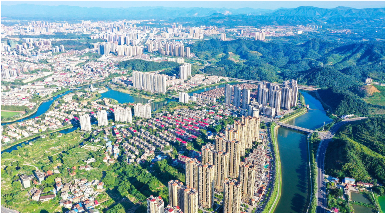
涂水绕咸宁,美景似画卷