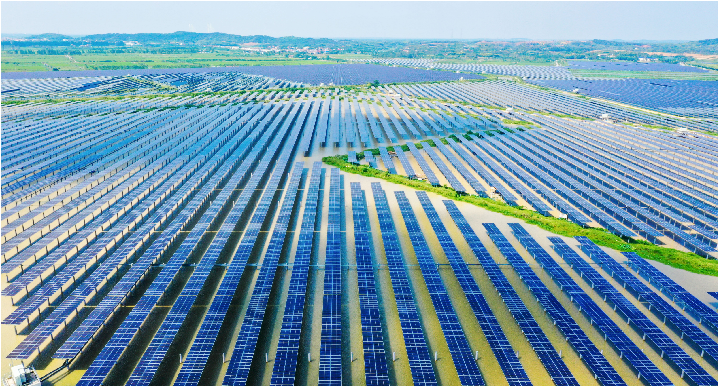
华润赤壁日曜350兆瓦渔光互补光伏发电项目