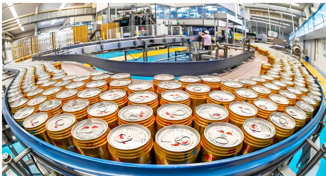
红牛饮料自动化生产线