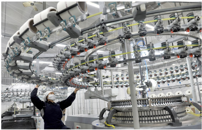
嘉麟杰引进先进的纺纱设备