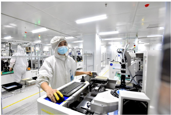
和信光电员工赶制光通信器件