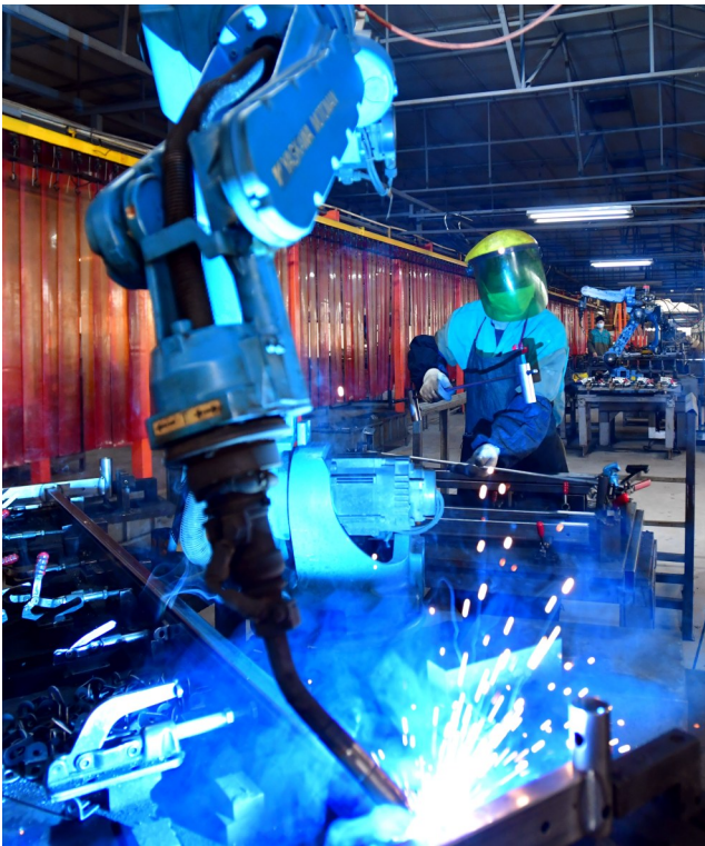
厚福医疗自动焊接机器人正在赶制订单