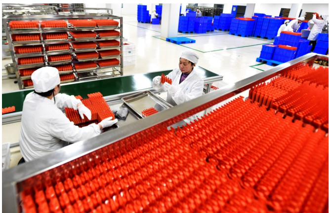
真奥药业工人在流水线上作业