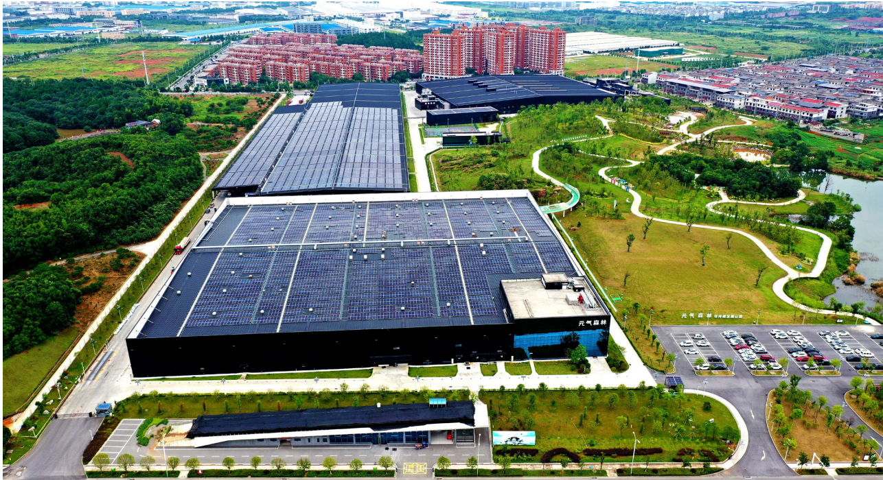
元气森林咸宁工业旅游景区