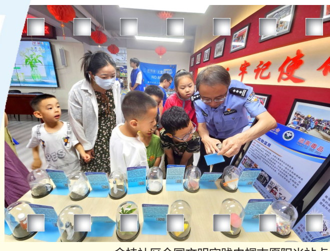
金桂社区全国文明实践中帼志愿阳光站点