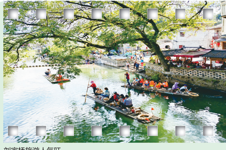
刘家桥旅游人气旺