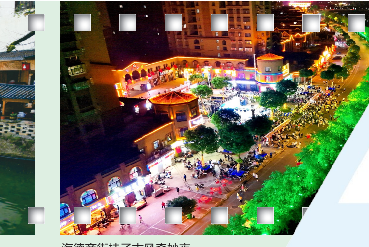
海德商街桂花古风奇妙夜