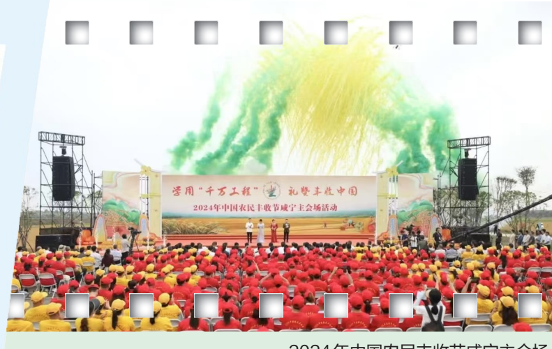
2024年中国农民丰收节咸宁主会场