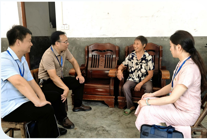
县纪检监察干部在天城镇浮溪桥村了解养老服务落实情况