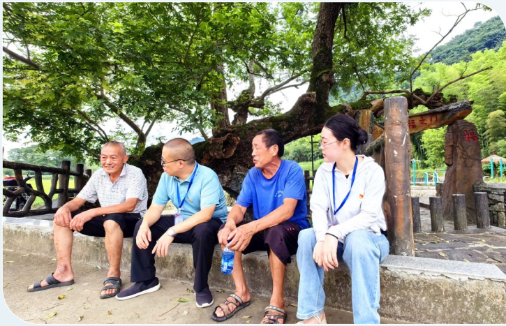
县纪检监察干部在桂花泉镇桂花村收集民情民意