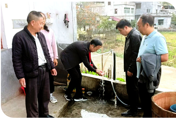
金塘镇纪委书记回访寒泉村通自来水情况